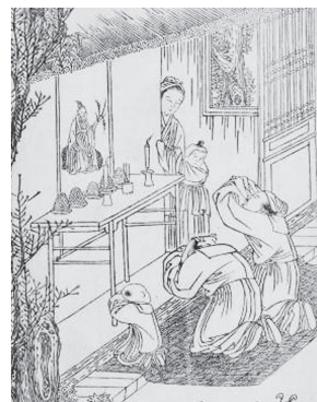
図25-3 耕23 祭神 拝礼する大人の傍らで真似ようと眺める男児と女主人らしき母子