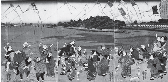
図29 歌川国芳『江戸勝景中州より三つまたは永代橋をみる図 天保頃 1830-1844

図28は、清時代の嬰戯図で、男児のみで凧揚げが行われているが、日本の浮世絵（図29）は男児女児が混じりあい凧揚げをしている情景を描いている。また、子どもの遊びを博物誌風に描いた歌川広重（1797-1858）『風流おさなあそび』では男児女児は別だが、歌川芳虎（生没年不詳）『子ども遊びつくし』（1848-1853年頃 嘉永）は、男児女児の遊びを混在させ、区分けしていない。