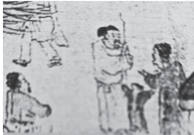
図21-3 談笑する大人の間の子ども

南宋の劉松年（生没年不詳）の『春社図』（図22）には、刃物を振りかざされた父親と子ども、慌てて母親を呼び出してきた子（図22-1）、酔っ払って騒ぐ大人たちの足元で拍子をとって浮かれる幼児（図22-2）、盲人の手を引く子どもと、祭りの宵を迎えた村の風景の中に描かれた子どもの姿が目を引く。また、明の職業画家周臣（1460-1535）の『漁邨図』の狭い船中には、母親に食べさせてもらっている子ども、破格の笑顔で母親から赤子を受け取る父親、魚籠に手を突っ込み探る子ども等が生き生きと描き込まれている（図23-1-4）。周臣には、明代の悲惨な流民を描いた『流民図』があり、痩せこけた赤子を抱く老婆の姿等、強烈な画題も描いている。図24（1-3）は、周臣の教えを受けた元漆職人で、同じく職業画家であった仇英（1497-1552頃）の作とされる『耕織図』で、大人たちとともに暮らす子どもの姿（男児・女児）が日常生活のさりげない情景として描き込まれている。耕織図は、農民の労苦を為政者に説く鑑戒と勸農の目的をもち、宋代以降、多くの絵師、画家によって描かれ、版本も複数系統ある。図25は、清の康熙帝が宮廷画家焦秉貞に描かせ、全図に御製の詩を付して刊行したもので、後代に大きな影響力を与えた。西欧遠近法の技能を活かした焦は、随所に子どもの姿を描き入れ、耕作と蚕織の全過程46図（耕23、織23）の三分の二以上に子どもの姿を見い出せる。子どもの仕草、動きの巧みな表現とともに、農村生活における子どもの役割、親子関係等、暮らしぶりが映し出されている点で耕織図の資料性は高い 25 。以上からもうかがえるように、子どもに特化しない風俗画