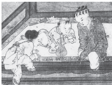
宋 蘇漢臣『嬰戲図』(部分拡大) 図13-1 ビードロを吹く男児