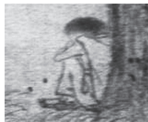
図8-2 孤愁 (部分拡大)