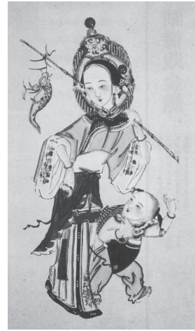
図41 清『漁婦』(対) 同音「漁」と「余」で富裕發財 を示す。