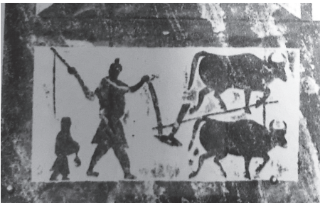
図1 後漢 牛耕点播（陝西省綏徳県） 大人が耕す後ろで種まきをする子ども