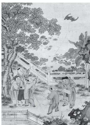
図28 清 焦乘貞『放风筝』

室町時代より日本に伝搬したとされる中国の子どもを描いた唐子絵は、日本画の狩野派の絵等に模倣作品が見られる。明代のきらびやかな百子図、嬰戯図が好まれ、唐子と呼ばれる中国習俗の子どもの姿のままの模写、同一、類似の題材による日本制作品や唐子の習俗を日本習俗の児童に置き換えた絵画大和唐も多数見られる。さらに、江戸時代に入ってから生まれる浮世絵の子どもを題材とする絵画への影響も大きい。子どもの遊ぶ姿のみを主題として展開された嬰戯図にならい、子どもの遊びのみを主題とした作品群「子ども絵」が多数見られる。遊びの種類には異なるものもあるが、子どものみを特化し、遊ぶ姿を主題とする構図、構成等、中国の嬰戯図との共通性が大きい。中国絵画による影響関係の跡付けも子ども観研究に有益な考察課題であるが、筆者は、子ども観比較考察のキーとして、絵画世界に描き出された子どもの存在、形象、及び子どもと大人の関係性を示す情景により生まれる特徴、固有性に注目している。