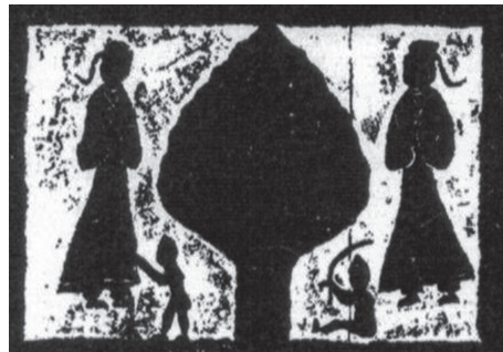
図4 後漢 母子図（陝西省綏徳県） 賀家溝磚梁漢墓門左豎樞