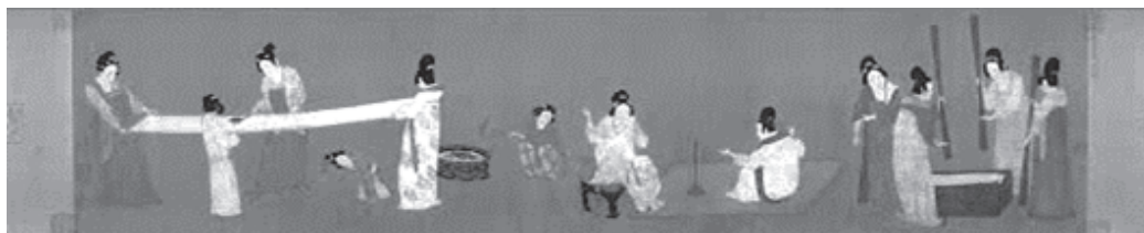
唐 張萱『搗練図巻』（全図）

女性と子どもを題材とする中国宮廷絵画仕女図の初期の著名な画家に張萱（713-755）がいる。畏冬は、張萱が子どもを題材とする絵画技法の発展に重要な貢献をしたと評価する記述があることに着目し、絵画の題材として「子ども」が重視されるに至ったと読み解いている 23 。『搗練図巻』（図5 宋代の模写）には、子どもらしい体形、柔らかく、しなやかな形象、愛らしい顔の造形、表情等の写実性に加え、好奇心に満ちた子どもらしい心理、動きが見られ、富貴華麗、豪華な風格を示す唐代宮廷画風の代表的な子ども形象が描き出されている。