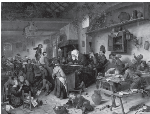
J・ステーン 図35 『少年・少女の学校』 1670年頃作