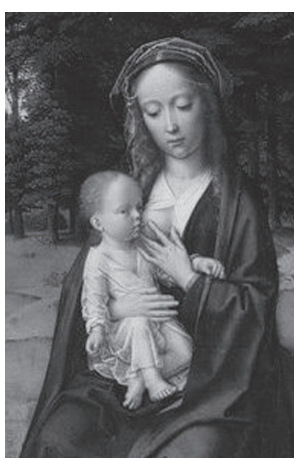
図48 ジェラルム・デイヴィット（部分） 『エジプト逃避途上の休息』1512 - 1515