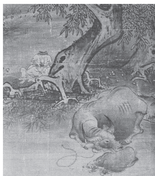
図9-2 牧童兄弟と親子牛 (部分拡大)