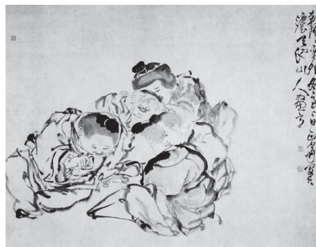
清 閔貞『童子奕棋図』 囲碁に興じる子ども、目隠しされる子ども

嬰戲図には、いろいろな子どもの遊び(凧あげ、将棋、かくれんぼ、水浴、拜佛等)、生活情景が示されているが、描き手により描かれる子どもの表情、絵画としての味わい、特色は異なり、時代的な変化も見られる。宮廷画家、職業画家に対し、文人画家は写実的な画風だけでなく、写意画法(対象の本質、描き手の内面、精神を投影する技法)による嬰戲図を描き、独自の子どもの形象を生み出している(図16)。なお、人々に好まれた嬰戲図は、子どもの形象を精緻にし、個性(表情、仕草)も描き分ける技能的な発展を促したが、子どものみをフォーカスし、大人と隔絶された時空間に子どもを取り込むことにより、実社会で子どもがもつ周囲との関わり、家族環境、人間関係、社会性等、社会的存在としての要素を切り落とすことにもなった。そのため、写実的な形象であるにもかかわらず、実態としての子どもではなく、子どもに対する象徴的な観念を示す特徴が生み出されていることを読み取っておく必要がある。