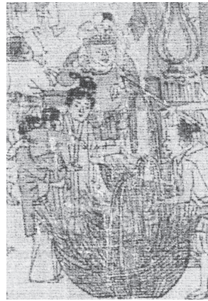
図21-2 買い物する親子 抱かれる子と父親に肩車される男児

図21-1 歩き始めた子どもを見せる父親 指差しながら見物に加わっている子ども（左脇）