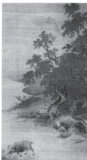
宋 閻次平 『秋野牧牛図』 図9-1 軸 全図