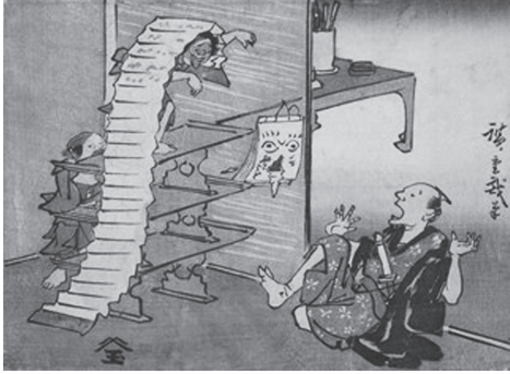
図31 歌川広重『寺子屋遊び』天保後期頃