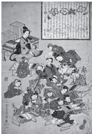
図33 一寸子花里『文学ばんだいの宝 末の巻』 弘化3年頃 1846 (女児) 自由奔放な女児の姿