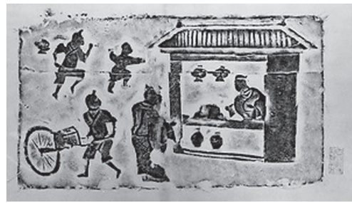
図2 後漢 酒肆画像磚（四川彭県） 酒甕を担いだ大人の前で楽し気に戯れる子ども