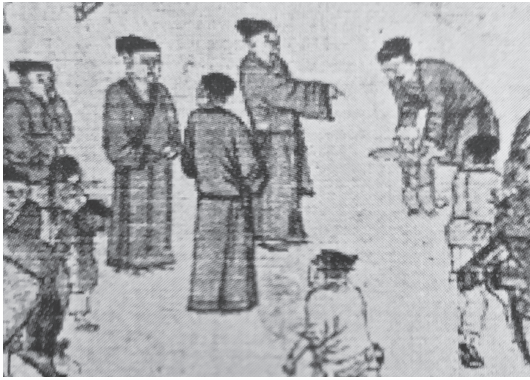
宋 張擇端『清明上河図』（部分拡大）

図21-1 歩き始めた子どもを見せる父親 指差しながら見物に加わっている子ども（左脇）