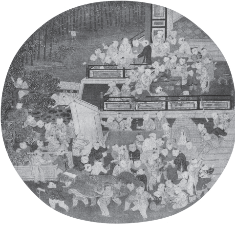
図17 宋 作者不詳『百子嬉春図』

象徴的な構図で描かれている。筆者が「吉祥の擬人化」と考える子ども像の源流、基盤として、年画の前身と位置づけることができる（図17、図18）。