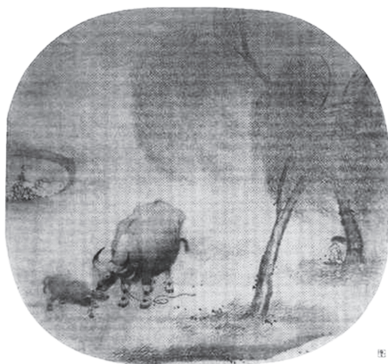
宋 作者不詳 『放牛図』 図8-1 親子牛と牧童

京故宮博物院所蔵)は、二人の牧童が川の中ではしゃぎ、喜び、帽子が流れているのも気づかない姿と、驚いて子どもを見る母牛と乳を飲む子牛の姿を通して、農村風景の素朴さの中に複雑な感情表現を描き込んでいる。孤愁を漂わす牧童と親子間の睦ましい愛情を象徴する母牛と子牛を描くことは、有名、無名を問わず放牧図の定番構図である(図8)。閻次平(南宋期1162-1189頃に活動、画院画家)の『秋野牧牛図』(図9 泉屋博古館蔵、国宝)では、子牛の体をなめる母牛と首を伸ばして横たわり、草を食むもう一頭の牛、少し離れた木の根元にしゃがみ、母牛と子牛の睦ましい姿を見つめる一人の頭を、兄であろうか、もう一人の牧童が虱をとるようなしぐさで覆っている。所蔵館の解説でさえ、のどかな農村風景を描いた作品と解釈しているが、幼くして働く貧しい牧童と愛情への渴望を映し出す親子牛との組み合わせ、さらに思いやりの情愛溢れる構図を加えた作品構成は、芸術的完成度の高さとともに子ども観の考察からも注目される。子どもを描き入れた放牧図は、農村風景を好む上層階層、宮廷画壇の嗜好も踏まえた上、より多面的、多角的な分析が必要となる。特に、西欧絵画には見られない牧童の孤愁と親子牛の愛情を対比する構図は儒教文化の影響も含めて、極めて興味深い課題、考察対象といえる。