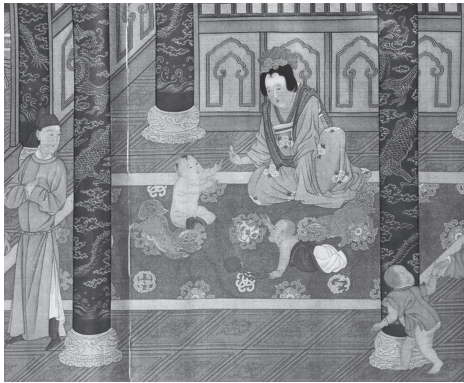
図6 唐 周昉『麟趾図』(部分)