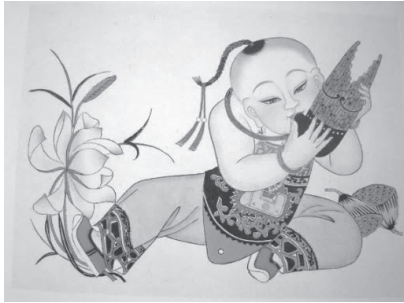
図26 『連生貴子』天津楊柳青年画 蓮の花（“連”と蓮は同音）、笙（“生”は同音）、石榴（多子）の吉祥モチーフ