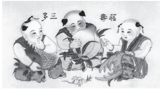
図27 『福壽三多』 石榴（多子）、壽桃（長寿）、佛手柑（多福）が一緒にあることが三福、吉祥を示す。

表現の特色は、素朴、明朗、活発、陽気、愉快、親しみ、喜びに富む等を基調として、装飾性が強い表現を重んじ、子どもの形象は、慶事、吉祥を示す象徴性を不可欠の要素とするため、写実的であることを求めず、描かれる子どもの形象は、形式的で、誇張した顔立ち、きらびやかで多彩な表現により作られ、眉目麗しい、細い眉、アーモンド形目、ふくよかな顔立ち、体つきで、色彩は紅、緑、黒、等の原色を多用し、鮮烈、鮮やかである。