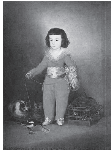
図12 ゴヤ『ドン・マヌエル・オソリー リオ・マンリケ・デ・スニガ』 1787-1788頃 6歳