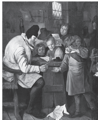
J・ステーン 図36 『村の学校』 1663-1665