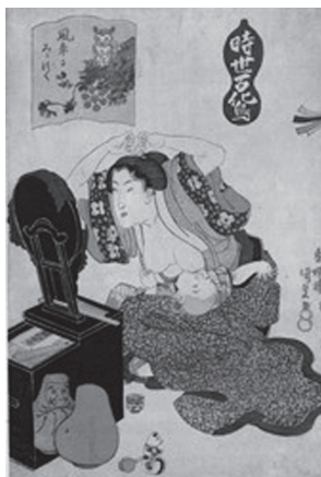
図46 歌川国貞 『時世百化鳥風車にみみずく』天保初期 女っぷりを上げたい母と乳房にぶら下がっても離さない男児