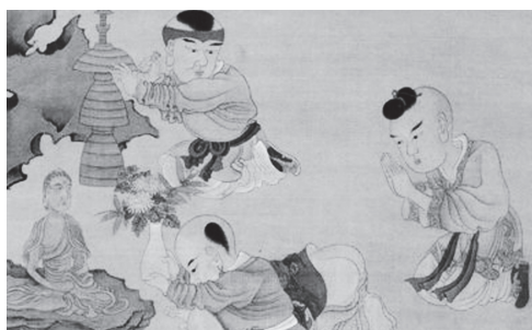
明 陳洪綬『嬰戲拜佛図』(部分) ユーモアあふれる構図