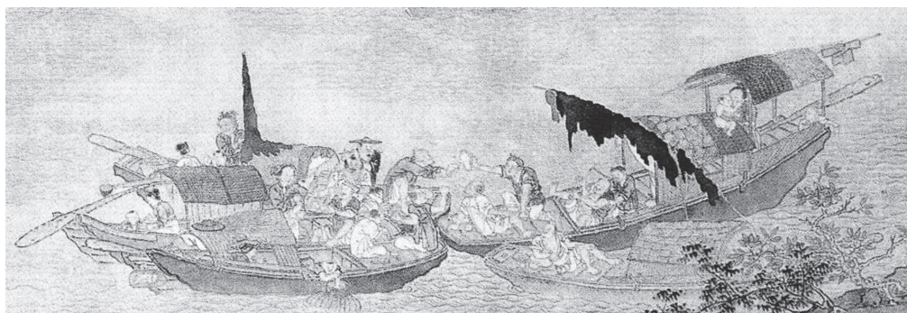
明 周臣『漁邨図』（部分拡大）