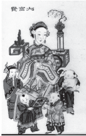
図39 清『大富貴亦壽孝』(対) 部分 女児1、男児3