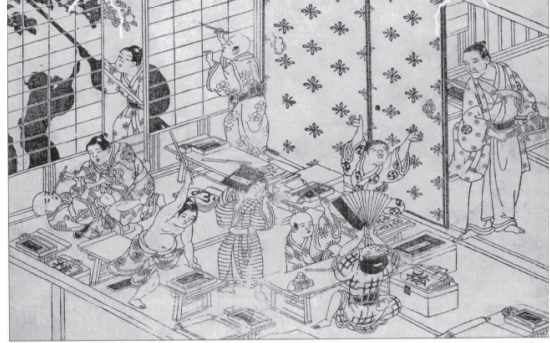
図32 下河辺拾水『画本弄』安永9年 1779