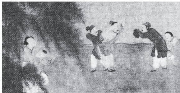
宋 劉松年『春社図』（部分拡大）

の中に、生活風景を通して描かれた多数の子どもの姿があり、それらの描き手には、李崇、仇英等、貧しい階層の出身者が少なくない。庶民の生活とそこに生きる子どもを見つめる画家自身のまなざしあつての子どもの形象化といえよう。