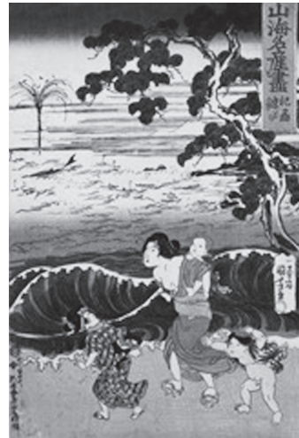
歌川国芳 『山海名産尽紀州鯨』 文政頃1818-1831