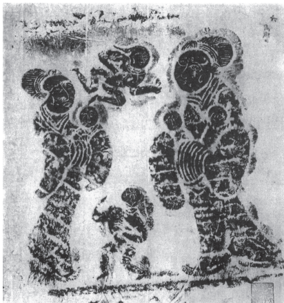
図3 後漢 母子図（山東省両城山） 左の母は1人、右の母は2人、両者の間に少女が1人、背後に1人、5人の子どもが描かれている。