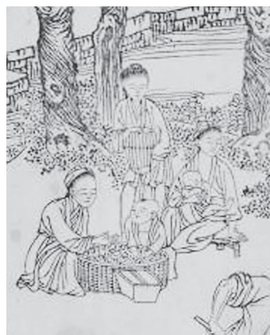
図25-2 耕20 簸揚（部分拡大） 母の作業を傍らで眺めている男児、背後に授乳する母子