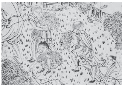
図25-1 耕15 収刈（部分拡大） 駄々をこねる子と働く年長の子どもたち