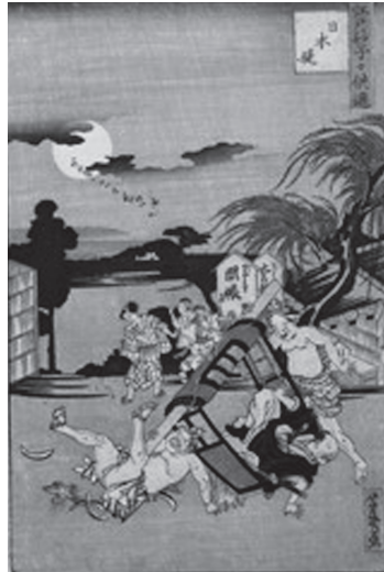
図34 歌川芳幾『江戸砂子供遊日本堤』 万延元年 1860