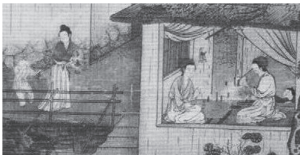
図24-3 10 ベそをかきなが歩く母子と、家の中で母と祖母（嫁と姑）が仲睦まじく糸継ぎをする様子を外から覗いて見ている女兒。母、子、姑三代を一軒の家に描き、家庭円満を示す。