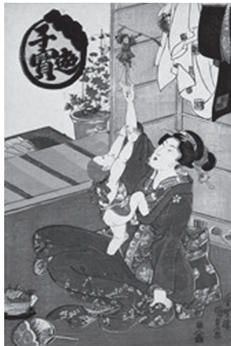
歌川国貞『子宝遊』 図43 からくり人形 天保頃