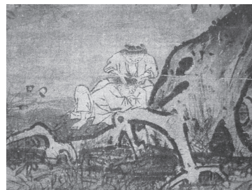
図9-3 牧童兄弟 (部分拡大)