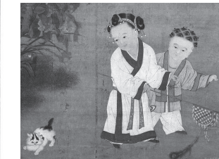
上図10-2 『秋庭戲嬰図』拡大 下図11 『冬日戲嬰図』部分