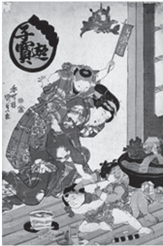
歌川国貞『子宝遊』 図42 けんか