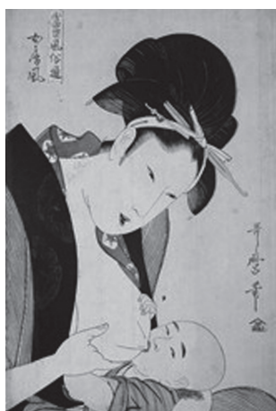
図47 喜多川歌麿『当世風俗通』 女房風 享和1801-1804