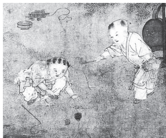
図13-2 コマを回す男児