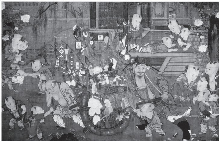
図19 宋 蘇漢臣『貨郎図』

宋代の経済発展により生まれたのが、行商人を描いた貨郎図である。明清時代には、様式化したきらびやかな宮廷画風による装飾的、様式的絵画に転じていくが、宋代には、宮廷画家の手によりながら素朴な農村を回る行商人と、これを取り囲む子ども、母親等を描いており、騒いだり、はしゃいだり、争いあったり、譲りあったり、満足したり、失望したり、好奇心にかられたり、といった生き生きとした子どもの様子がふんだんに盛り込まれている。蘇漢臣の貨郎図（図19）は、宮廷風の華やかさで描かれながら慈愛や素朴な表情を見せる行商人の形象、小さな兄弟喧嘩、好奇心に満ちた子どものほほえましい姿等で高い芸術性と親しみやすさが評価されている。