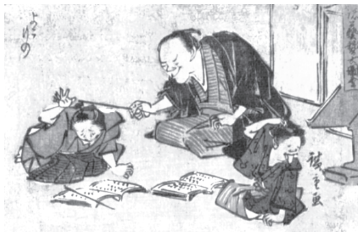
図37 歌川広重『諸芸稽古図会』(一部)天保後期頃