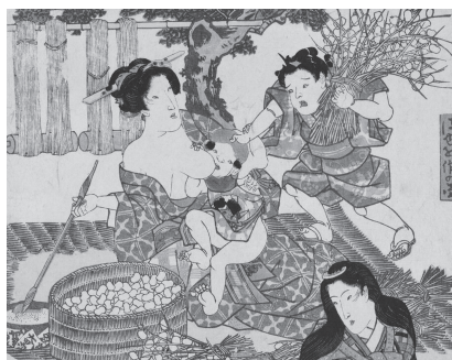
図45 五風亭貞虎（歌川貞虎） 『蚕家産業之図』文政（1800年代初期） 働く母の乳をほおぼる男児とやきもちから思わず邪魔する兄