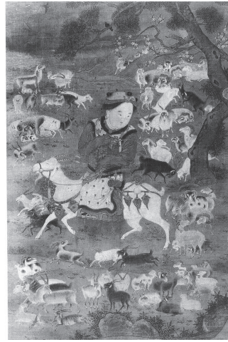
図18 宋 蘇漢臣『開泰図』 満開の紅梅と羊に乗る男児