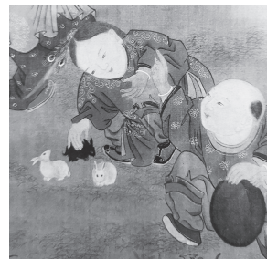
元 作者不詳 『秋影嬰戲図』(部分拡大)