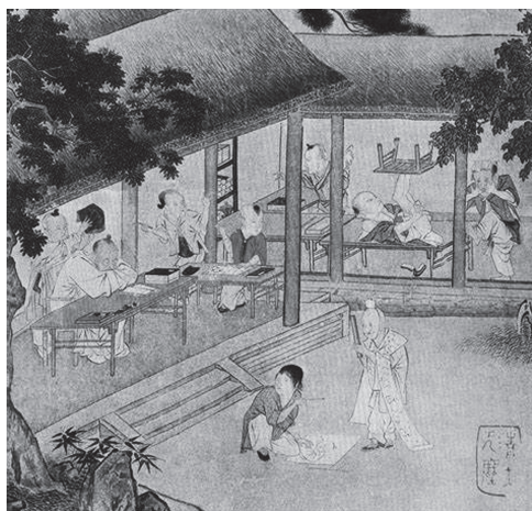
宋 作者不詳『村童闹学图』仇英模写

子どもと学びの題材では、子どもの本性、性格をどうとらえるか、人間性の根源となる性善説、性悪説に根ざした教育観、原罪説による宗教観等の考え方による影響が大きい。本稿の課題を越えるため、直接考察対象には加えないが、15～16世紀のフランドル派の絵画は、プロテスタントティズムの原罪説により、子どもの遊びを放逸さの象徴とし、奔放な子どもの性情を否定的に捉えるため、学校風景も戒めの場として描かれている（図35、図36）。ロマン主義時代は子どもの本性に無垢、純真さを理想とみなす心性により子どもの形象、情景が変化し、革命期には支配層への批判性が積極的に盛り込まれる等、大人の観念の投影が如実に映し出されている。