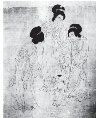
図7 周文矩『宮中図卷』「開歩」

張萱に学び、その画風を継いだとされる周昉（766-785）の『麟趾図』（図6）は、宮廷における男児の生活情景を描き出した華麗で優美な作品で、子どものあどけなさ、ふっくらとした肢体の形象と描写、みやびやかな雰囲気の中で入浴、遊ぶ姿等が描かれている。同じく張萱派の周文矩（五代南唐、生没年不詳）の『宮中図卷』（宋代の模写）には「婦人、小児数八十」との記述が残されているが、現在確認されている子どもは十数人である。3人の官女に囲まれたよちよち歩きの男児の興奮と恐れを示す表情が鮮明な「開歩」（図7）、2人の女兒が2匹の犬を脅してからかう、いたずら心を描いた「戯犬」等、生き生きとした子どもの姿は、子どもの生活に対する関心、観察力、表現力あつての表現といえる。