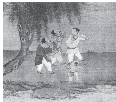
図22-2 酔っ払いと浮かれる子ども