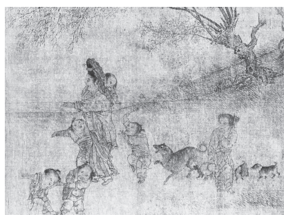
図20-2 母に甘える子どもたち、奪い合う兄弟、少女とその背後の犬の親子（部分拡大）

きらびやかな蘇漢臣に対して、家具職人から身を起こし3代の宮廷に使えた宮廷画家李崇（455-525）、農村を訪れた行商人を取り囲んだり、駆けつける母親と子どもの賑わいととも、その賑わいからはずれてぼつんと一人寂しげにたたずみ、指を加える少女の姿を描き込んでいる（図20）。下層階級から身を起こした李崇の作品は、卓抜した精緻な筆さばきとともに、農村の生活風景、貧しい民衆への眼差し、貧しい少女の内面をもとらえる独自の視点が生立っている。また、先の放牧図で言及した李唐の『灸艾図』には、灸をすえる男を取り囲む村人に混じり、大人の背からこわごわ覗きこむ子どもの姿が描かれている 24 。子どもに目を向ける絵師、画家の個性が子どもを題材とする絵画の芸術性と内面的な深みを生み出している点に注目したい。