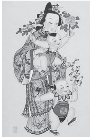
図40 清『母子図』(対) 母と男児2